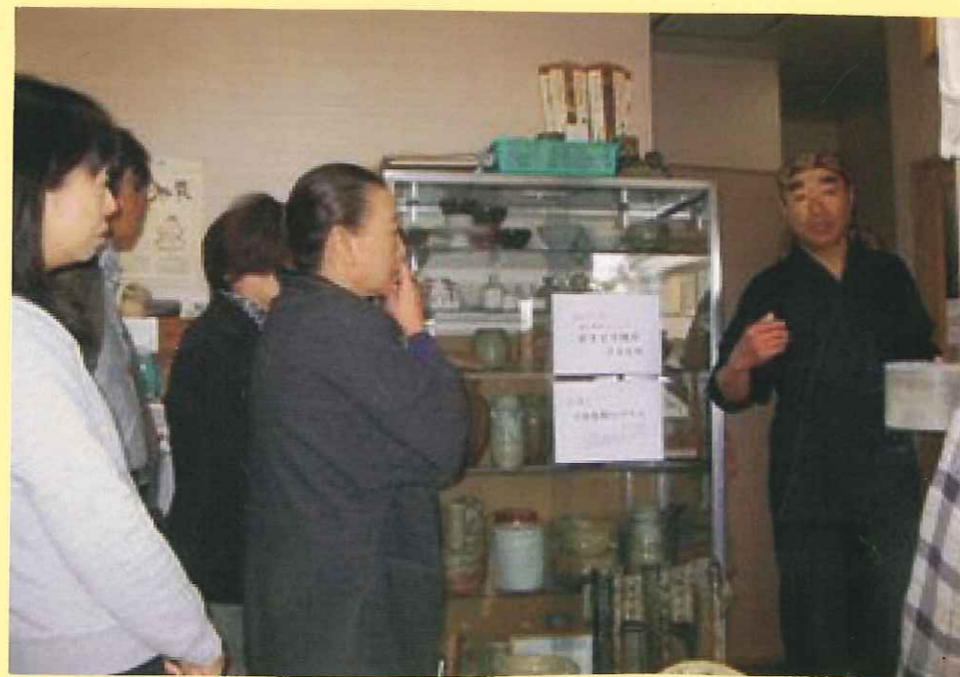
😊 お店の器や、写真に写っている陶器は、ご主人の手作りです。

右の写真はご主人に説明してもらっている様子。→ 真剣な表情ですが、ジョークも飛び交い、和気あいあいとした楽しい雰囲気でした♡