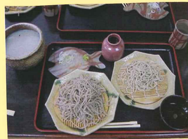
😊 右のおそば+割そば、左のおそばニハそば。おそばの風味もつるりとしたのどごし最高!! 左上は「そば湯」です。とろりとしていて「何だこりゃ〜!!」っていうくらい美味♡♡