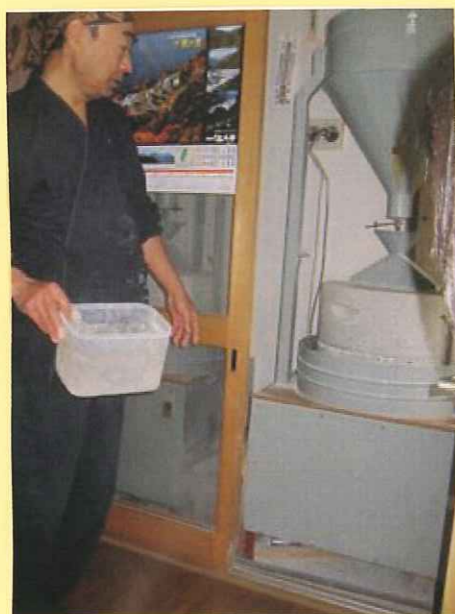
😊 そば米粉をひく石うすは何と2台!! そば殻がついている用とついていない用で分けているそうです! ここにもご主人のこだわりがキラリ! ✨ 石うすも石材屋さんのこだわった物で、13年間 メンテナンス一際不用!! スゴイ!!