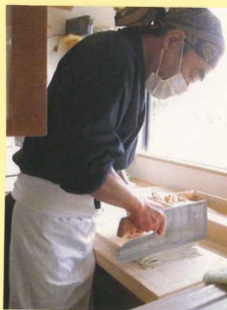
😊 そば打ちを始めて14年目。独学でここまできたそうです! ビックリ目