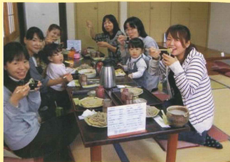
😊 わたぼうしのママとお友だちもおしゃべりを楽しみながら幸せなひと時を過ごしました☆ ありがとうございます!!