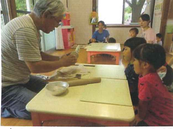
陶芸教室、ベビーマッサージ etc... 外部講師 によるイベント活動。今回は新田小学校の校長先生が 来てくれたヨ!