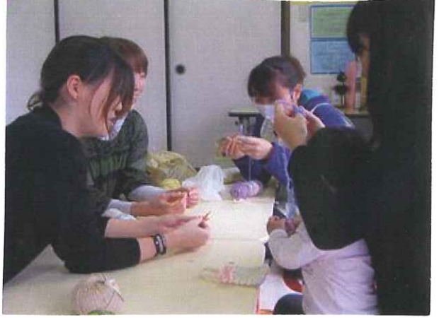
お母さん達の得技や趣味を生かして、教室を 開いてもらいます。講師になったお母さんも 自信につながります。