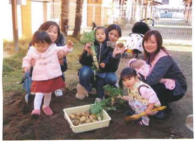
土いじりって楽しいね☆ 収穫したお野菜が クッキングも楽しもうぞ!!