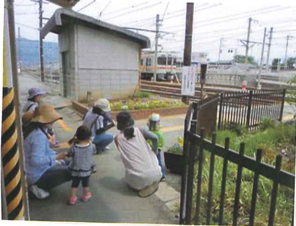
ごんちゃんさん バスボーイ!! のんびり、ゆったり～ みんなで地域の中 をお散歩♡