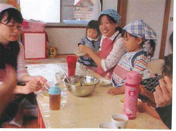
保育園のおやつメニューや、旬の食材を使った おやつ作りを楽しみます♡