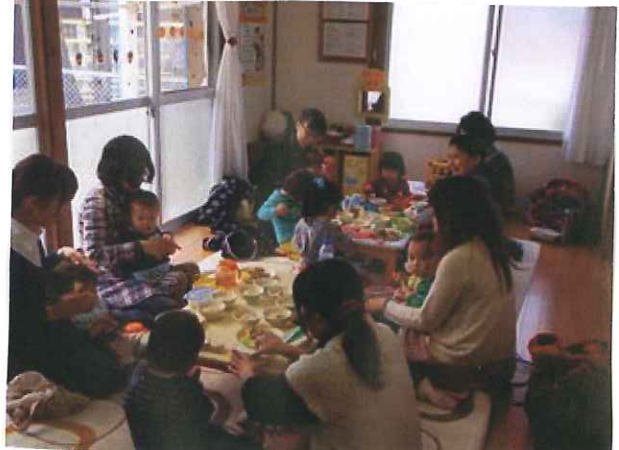
みんなが保育園の給食を食べます。食に対する 意識もUP↑