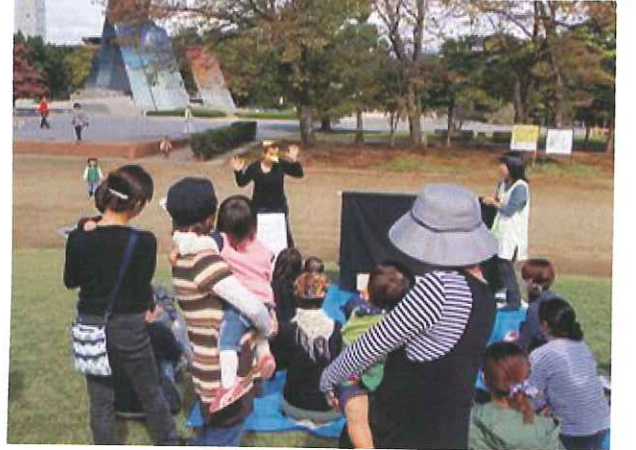
公園へ出向き、イベント開催。あびに来ている 親子をキョウチ!! 春(3~6月) 秋(9~11月) に開催。