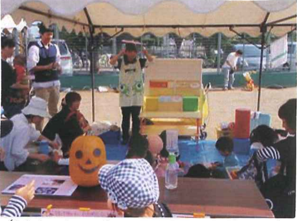
愛育会の方々と協働して地域のお祭りに参加 します。