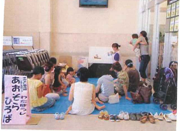
近くのスーパーをお借りして毎月1回イベントをします。 買い物に来た親子も気軽に参加していただきます。 夏(7~9月) 冬(12~2月) に開催。