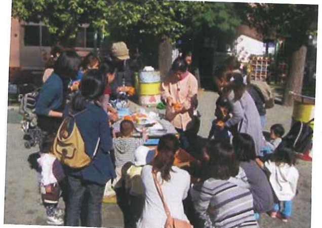
給食の先生が作り方を教えてくれました♪ お母さん達も興味津々!!