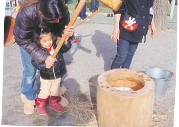
園行事と一緒に参加！ わたぼうしに来た からこできる体験をたくさんしちゃろぞ!!