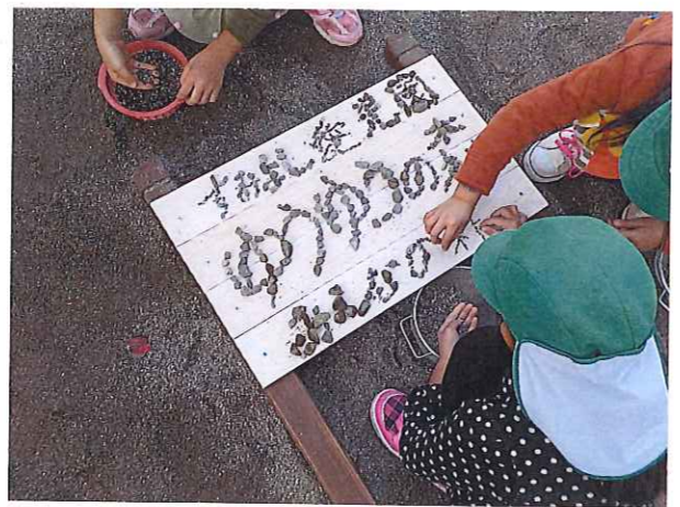
看板作り☆どんなデザインにしようかな!?

山の活動 ~ 植樹をしたり、間伐体験をしたり、ここでしか経験できない事もたくさんあります