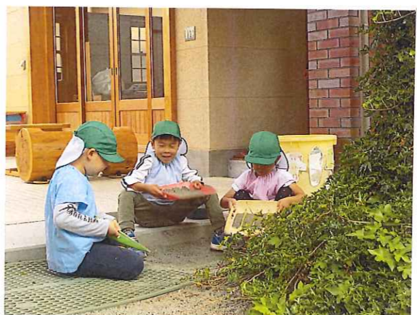
どの場所が極上のすべり台が作れるか!? 経験豊富な年長さんはよくわかっています♡