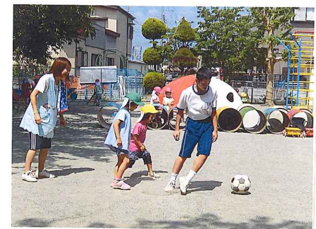
職場体験、インターシップのお兄さんお姉さんはみんなだ~いすき♡子ども達に近い存在で沢山のあそびをくれて嬉しいね☆