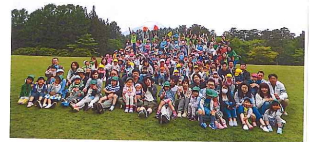
大自然の中で子どもも大人もリフレッシュ!! 親子関係なく、みんなが関わり合っ、ステキな時間が流れます♡