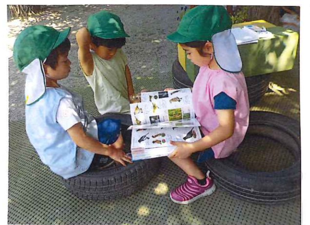
自然とできた青空アトリエ