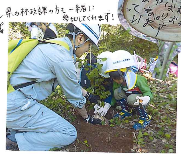
県の林政課の方も一緒に参加してくれます!