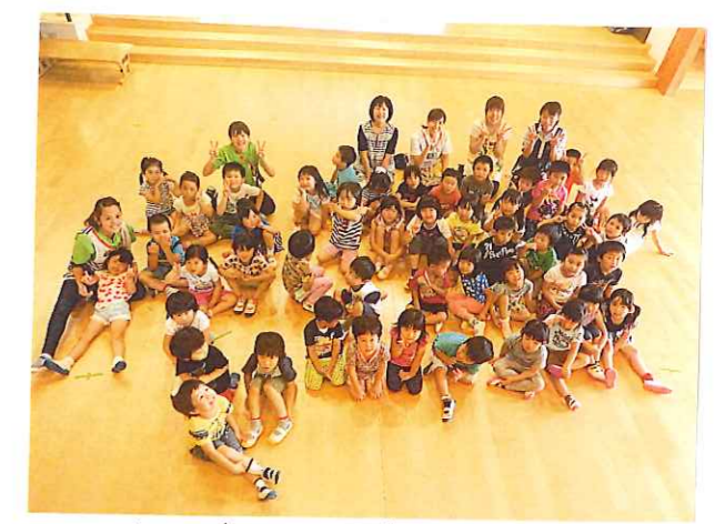
石和第五保育所との交流会♡東京都にも王子本町保育園と日暮里保育園が姉妹園があります。職員同士も合同で研修をしたり、同じ思いを持って仲間がいろいろです♡