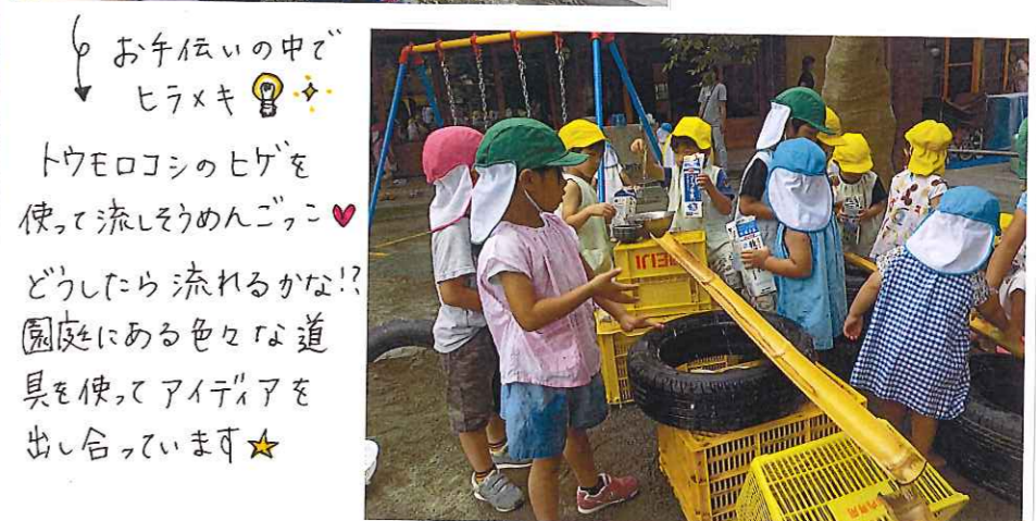
お手伝いの中でヒラメキ ♪ トウモロコシのヒゲを使って流しうめんゴッコ♡ どうしたら流れるかな!? 園庭にある色々な道具を使ってアイデアを出し合っています☆