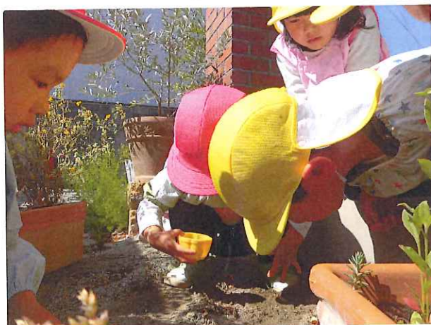
「だんご虫いた～!」「どこ?」 プランターの下、植木鉢の下などなど... どんな所に住んでいるかをよく知っています♡ 宝物はポケットへ... スモックのポケットからだんご虫が出てくる事も!? わぁ～