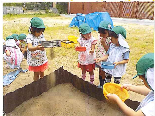
ゆうゆう倉官(学童保育)のお兄さん、お姉さんにもお手伝いをしてもらい、畑を耕しました。毎年色々な野菜を育てています。

「あそこにいるー!!」園の裏の川には色々な水中生物が住んでいます!ザリガニGETできるかな!?