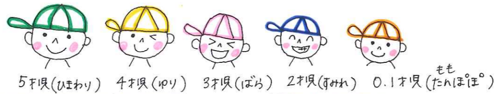
5才児(ひまわり) 4才児(ゆり) 3才児(ぼら) 2才児(すみれ) 0.1才児(たんぽぽ)