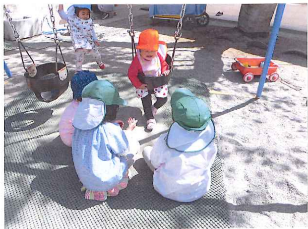
自然に目線を合わせて、小さいお友達と関わってくれます♡ 年長さんも小さい頃はお兄さんお姉さんにこんな風に関わってもっていました☆