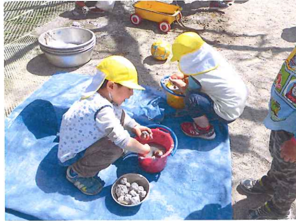
新聞紙をちぎって濡らして混ぜて... こうしてみるとどうなるかな!? 探究心がムクムク!! 研究者がいっぱい☆