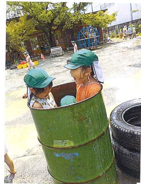
水 ドラム缶風呂最高～!! 暑い日は全身・泥だらけ 水まみれになって大はしゃぎ!! 「水まみりの水がお湯になる!?」 不思議～??? どうして??? 毎日たくさんのお水をしています。