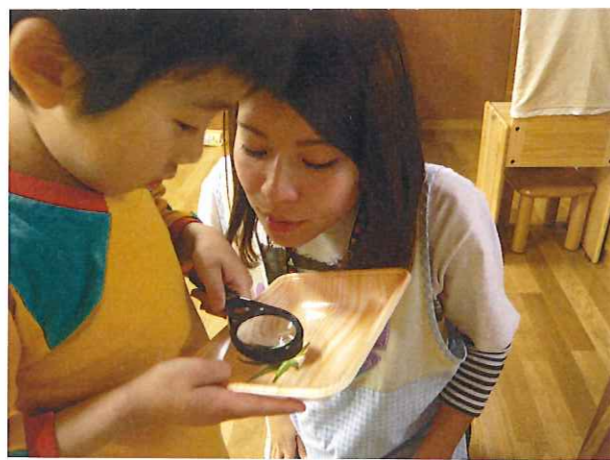
虫メガネで捕まえた虫を観察中～ 子ども達はもちろん・先生も夢中～!!