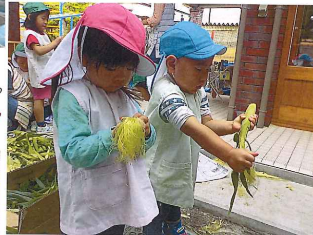
トウモロコシの皮むき 皮をむいたモロコシは給食室へ... おやっになって登場!! トウモロコシってこんなに皮をむくんだね! 経験の中で知識を吸収～ ♪