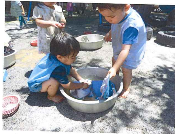
洗たく板ご巾着子をゴシゴシ ♪ あそびも生活につながっています♪