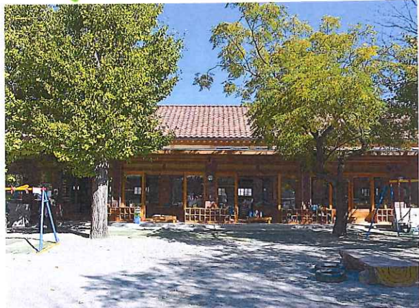
ゆったりと穏やかな時間が流れ、子どもも大人も居心地の良い空間... そんな場所で毎日色々な物語が生まれています☆