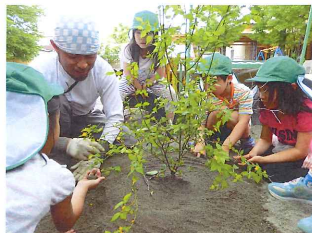
森に植える木の事を庭師さんに教えてもらっています! すみよし愛児園には子ども達のために協力してくれる方々がたくさんいます♡

木のぼりだ～いすき♡ ロープが登れるようになると木登りに挑戦できるヨ♪ 手にはマメがいっぱい!! 通称「かんぼりマメ」 ロープ →