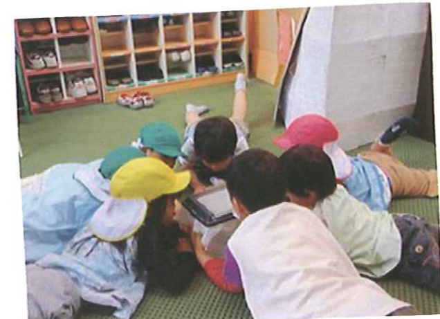
♡😊 いっぱい汗かかすけれど、その分糸も ぐ〜んと深まる子どもたち。一緒に笑って 一緒に泣いて... みんな兄弟、みんな家族。