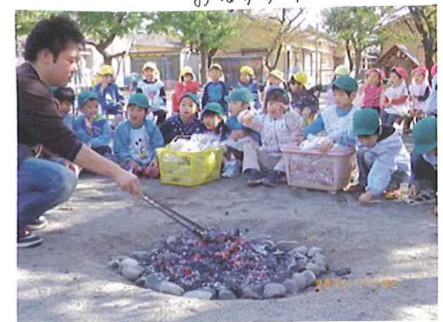
あま〜い、いいにおいがしてきたネ!! 早く焼き芋が食べたいな♡