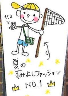
夏のすみよしファッション NO.1