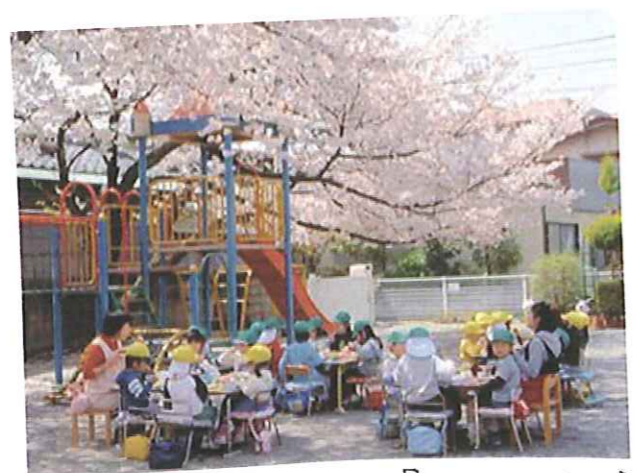
お庭の桜の下で『お花見ランチ』♪ お外で食べる給食は一段とおいし〜よび