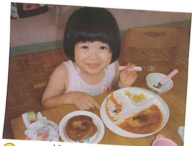
😊 おいしい顔ってこんな顔♡ すみよし愛児園の給食は、安心・安全!何より おいし〜!!