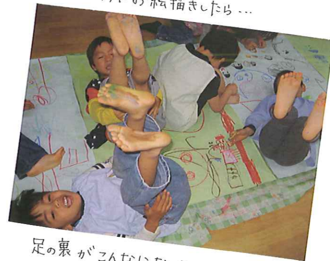
足の裏がこんなになっちゃった〜♡ ウフッ♪