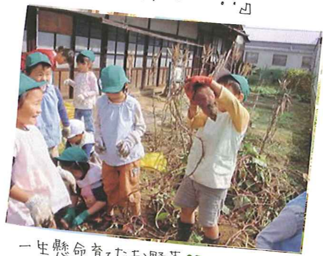
一生懸命育てたお野菜🌱 収穫の喜びを知る子ども達です♪