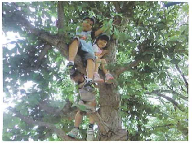
木の上からの眺めは最高!! ちょっとした秘密基地だね♪