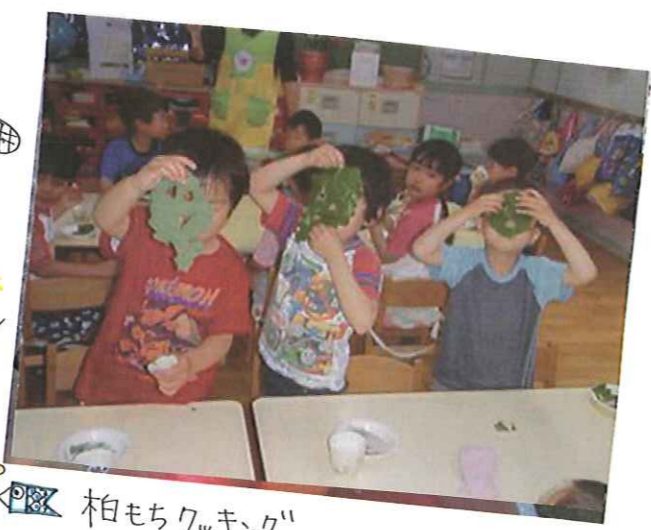
🌿 柏もちクッキング 季節に合わせて色々なクッキングをしています 食に対する興味もムクムク🌱