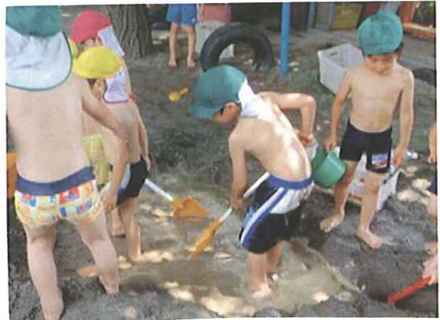
🌊 泥んこ風呂のできあがり〜る!! お水も泥んこもみんなだ〜いすき♡