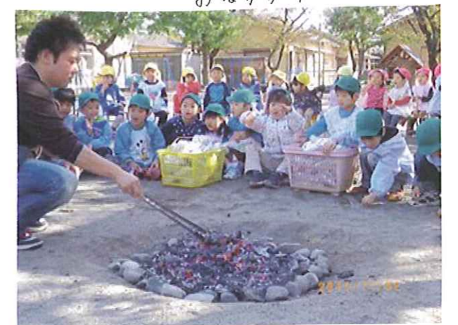
あま〜い、いいにおいがしてきたネ!! 早く焼き芋が食べたいな♡