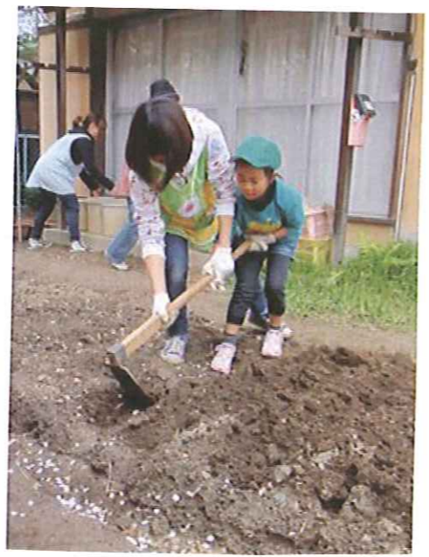
きゅうり・ミニトマト・枝豆・さつま芋 etc...を 育てるヨ☆ 作る野菜は子ども達が相談して 決めてます。