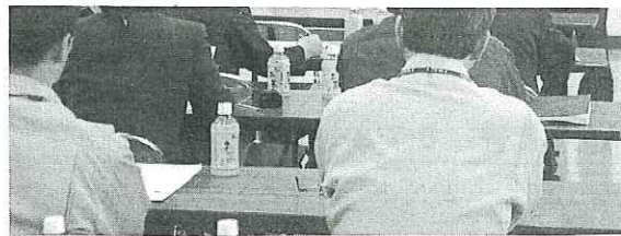
小淵沢総合支所で開かれたSLの運行説明会

「キャンペーン」の一環として、五月二十九、三十日と六月五、六日の四日間、小淵沢駅と甲府駅間でD51型蒸気機関車の臨時列車の運行を予定している。